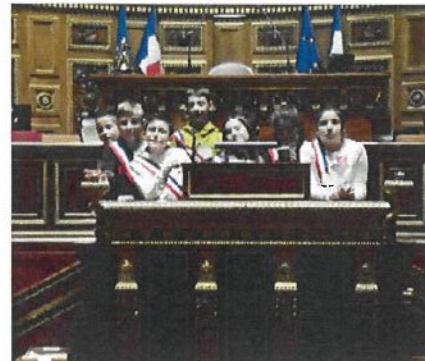
Visite du Sénat