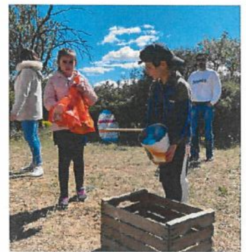
Chasse aux oeufs