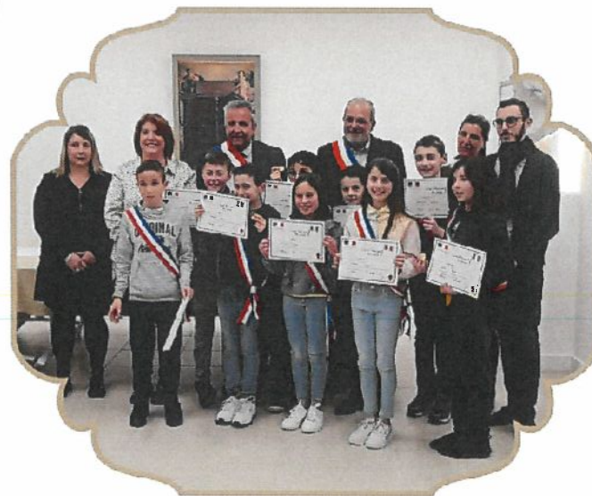
Ancien CMJ remise des écharpes