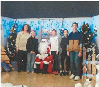
Marché de Noël